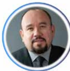
Secr. de Actas y Coord. de Residentes